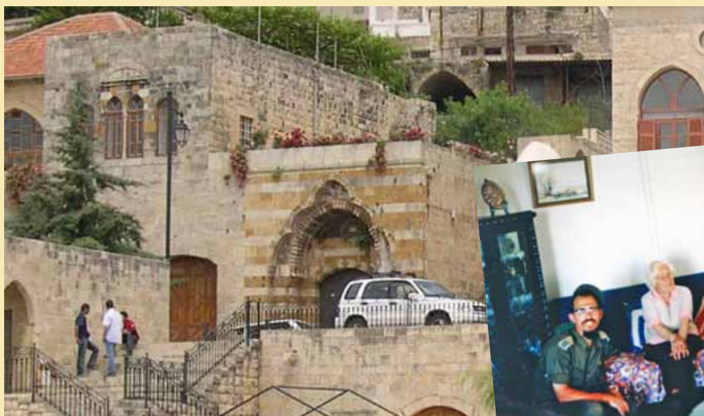
בית הכנסת בדיר אל קמר

לאחר שהסתיימה הלחימה שוטטנו באזורים שהיו בשליטת כוחותינו, נפגשנו עם מנהיגי ישובים ומפקדים נוצריים וטיילנו באתרי טבע שונים - בהרים ובנחלים. פה ושם שאלתי אם יש יהודים בכפר. את התשובה החיובית קיבלתי בעיירה המארונית דיר אל קמר. סופר שיש בו בית כנסת ונאמר לי שגרה בו אשה יהודיה. חיפשנו ומצאנו את ביתה. שמה היה הנרייט סידי. הפגישה, בביתה היתה מרגשת. בעודנו שוהים בלבנון, הגיעו ימי החנוכה. באחד מערבי החג הגענו אל ביתה, נקשנו על הדלת והפתענו אותה כשבידינו נרות. לאחר שחלפה התרגשותה, היא ביקשה מאיתנו להמתין והלכה לחפש חנוכיה. כך, עם הנרות הדולקים, המשכנו לשמוע על חייה כיהודיה יחידה בכפר נוצרי.