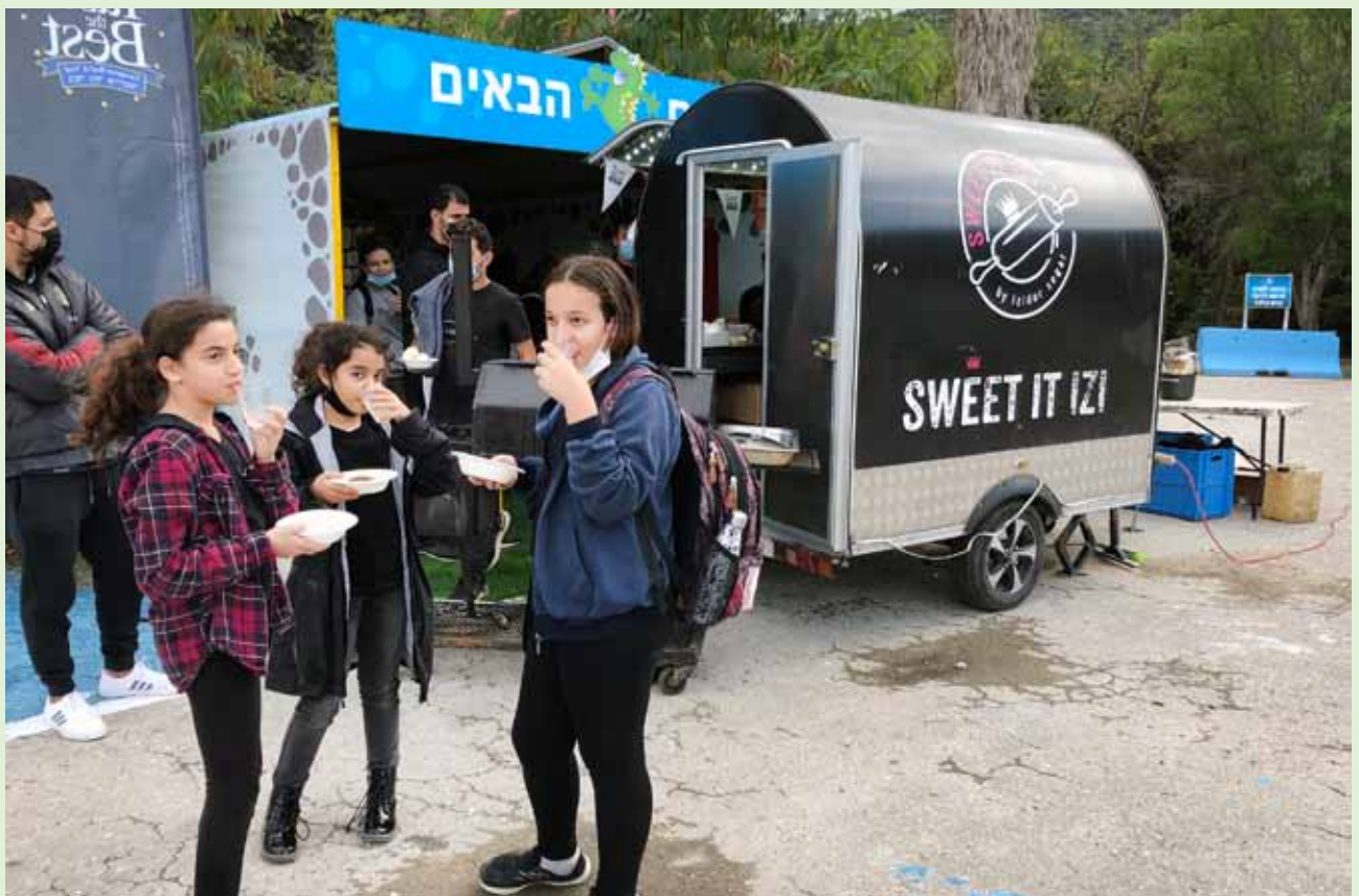
מתנות קטנות: מיזם מזון חדש עצר ביגור לטעימות ככה באמצע היום

לסיכום , אנו מאמינים כי איחוד הכלבו והמרכולית במחסן התאים ממוזג בתוכו גם התייעלות כלכלית, גם עליית כמה מדרגות באיכות השירות הניתן לחברים, ומעל הכול מהווה בסיס למרכז קהילתי בליבו של הקיבוץ למפגש ולפעילות של חברים ומשפחות לרווחת הקהילה היגורית כולה.