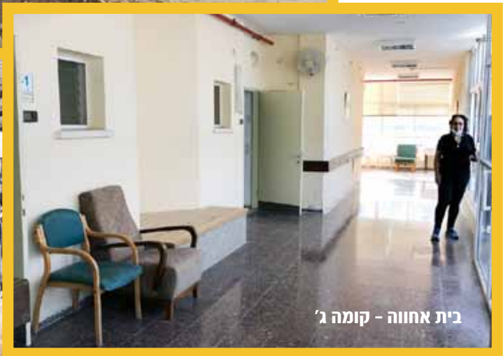
בית אחווה - קומה ג'