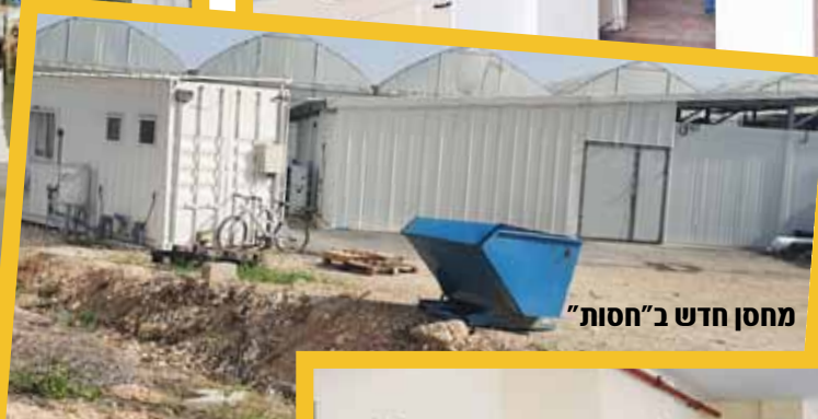
מחסן חדש ב"חסות"