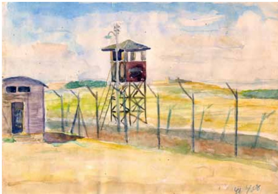
מחנה המעצר בלטרון, ציור: שרגא עוגן

הבגדים שדדו סחורה של הרבה מאות-אלפים. אך יגור עמדה! בלילה הזה ארבעתנו לא הצלחנו לישון!