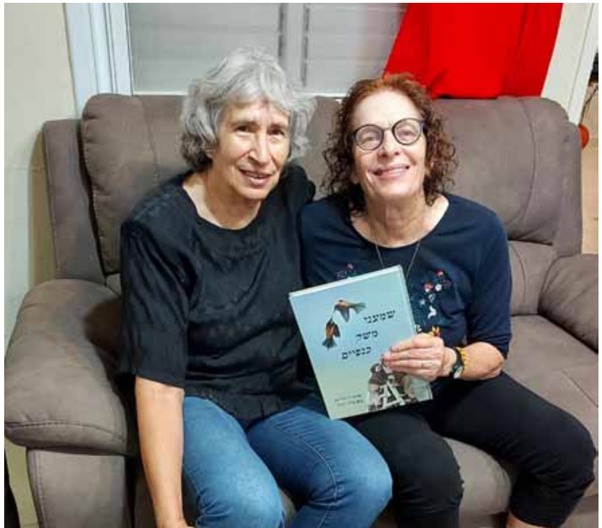
צילה רפופרט (פלד)

נכון. מדובר ב-70 סיפורים. שלוש שנים של קבלת הסיפורים ושליחה של הערוכים לאישור הכותבים. בשלב מסוים, איה אמרה לי שהעבודה של ההגהה והעריכה גוזלת הרבה מזמנה והיא שואלת את עצמה, "למה נכנסתי לזה בכלל?" שאלתי אותה חזרה, "מה ענית לעצמך?" התשובה שקיבלתי ממנה הייתה, "אני עוסקת בסיפורים יפים מהילדות שלנו, המסופרים על ידי חבריי שגדלו אתי ויקרים לי עד היום, ואני נהנית מכל דקה של עיסוק בחומר."