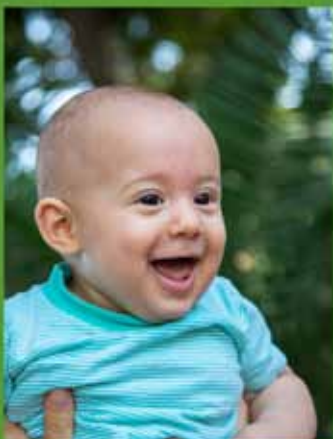
רבאל סביט רשלי (חאיר ורותן)