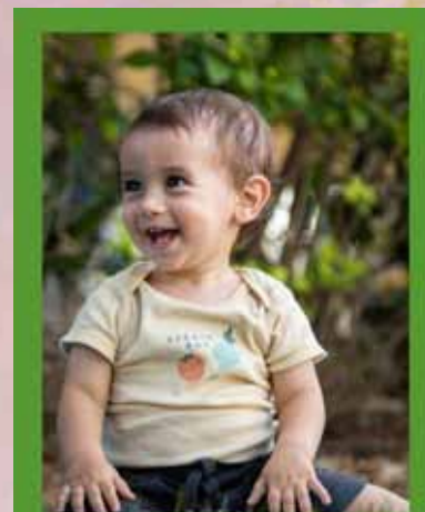
ליסד האס (יסרה וסרן)