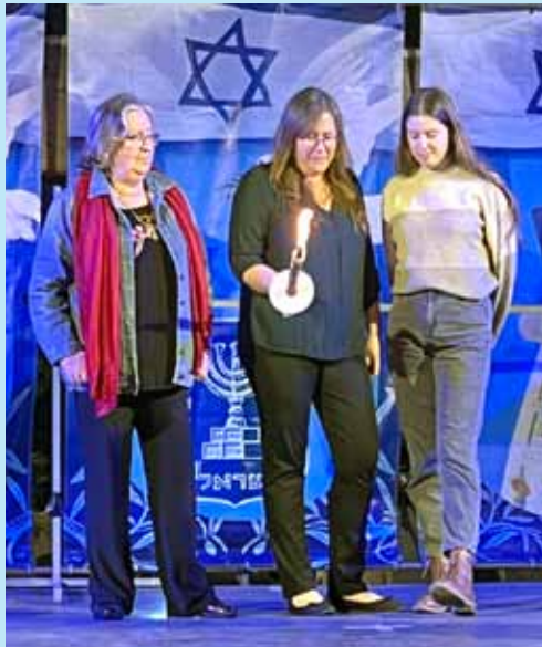
החטיבה, תוך ניתוח נתונים מקצועיים והובלת פרויקטים בעולם מדעי ההתנהגות. לכבוד נשות ואנשי בריאות הנפש ולמען חוזקה של החברה הישראלית ולכבוד חברה רב דורית ביגור.