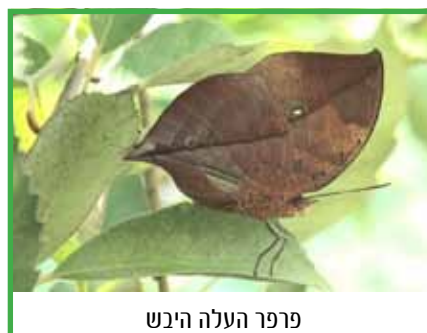
פרפר העלה היבש