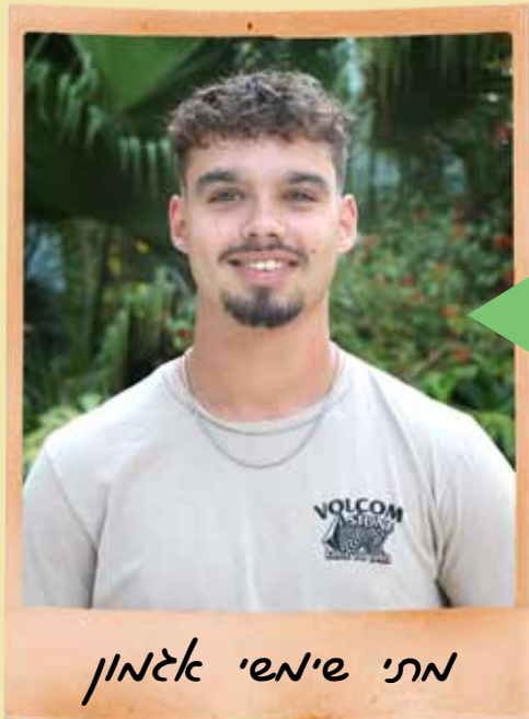
חתי שיאשי אלמון