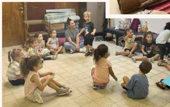
גן אורן במקלט בית בר יהודה