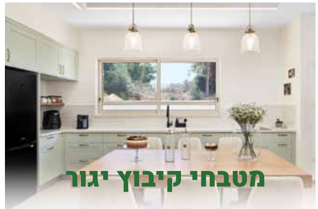
מטבחי קיבוץ יגור